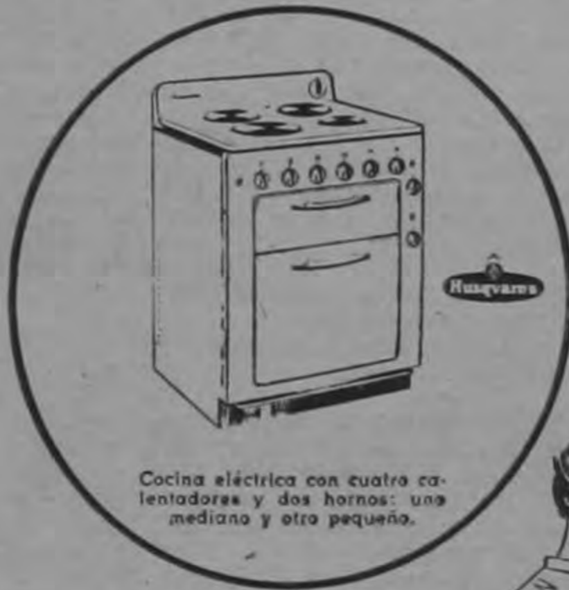
Cocina eléctrica con cuatro calentadores y dos hornos: uno mediano y otro pequeño.