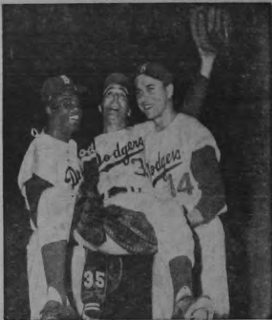
Sal Maglie el lanzador del Brooklyn de 39 años de edad es cargado por sus compañeros del Club Jackie Robinson y Gil Hodges después de ganar 4-2 el juego que llevó a los Dodgers al primer puesto en la Liga Nacional, empatando con los Bravos de Milwaukee.

Hacemos llegar al caballeroso jugador nuestro saludo, deseando verlo de nuevo en acción muy pronto.