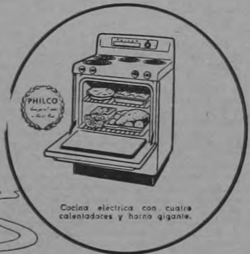
Cocina eléctrica con cuatro calentadores y horno gigante.