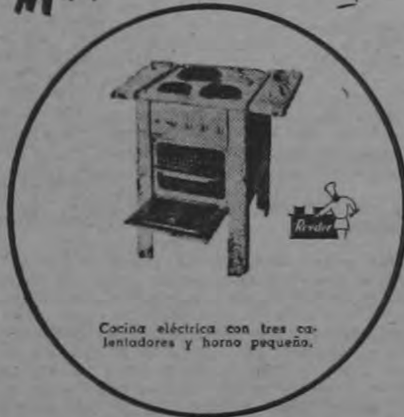
Cocina eléctrica con tres calentadores y horno pequeño.