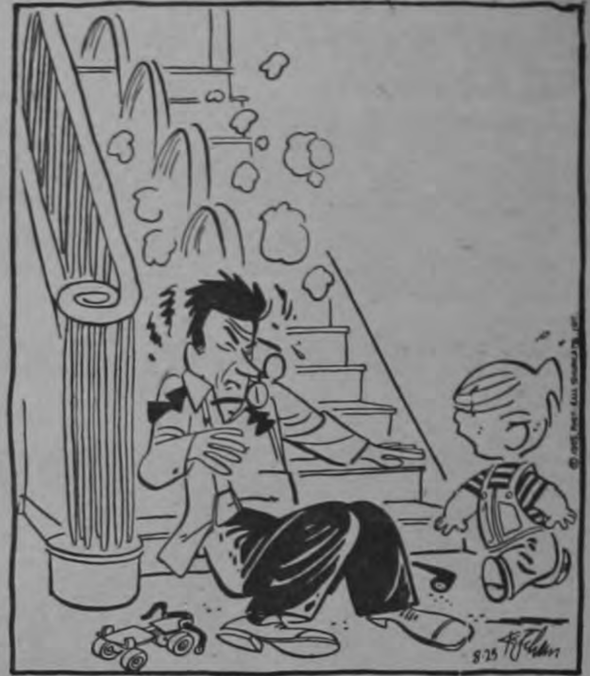
¿Me rompiste el patín?