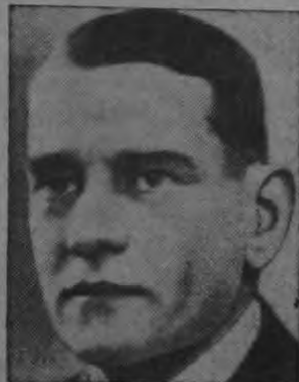
PRESIDENTE COTY ...condecoró a Figueres...