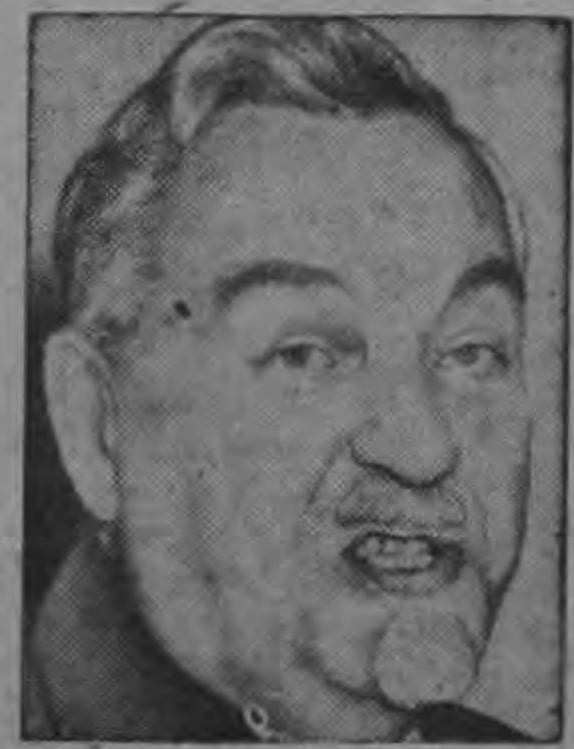
PREMIER BULGANIN ...solo seis potencias...

Hace un año duerme en la Asamblea proyecto de ley para la tenencia de animales